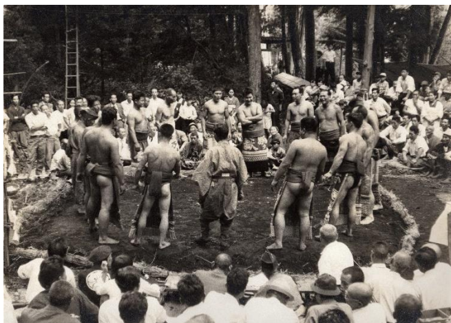
上小曾部八幡神社での奉納相撲(昭和20年代)