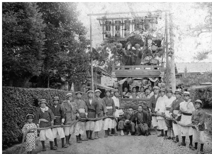
槻井泉神社例大祭での山車(大正8年7月)