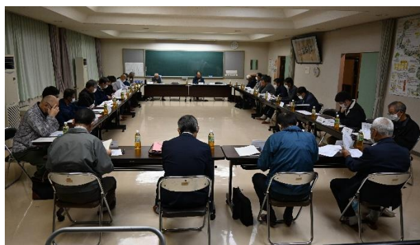
「編集委員会」（令和5年10月、洗馬支所会議室）