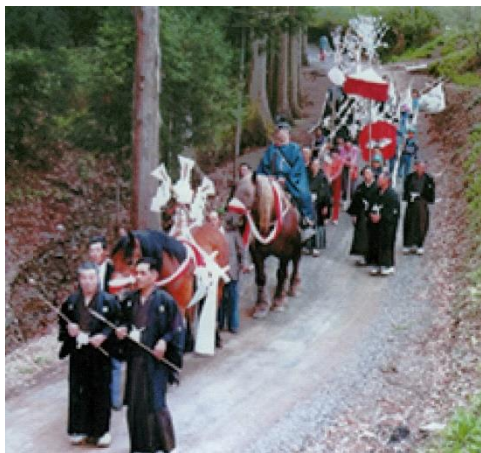
とぎよ 御神馬渡御の行列(平成の始め)